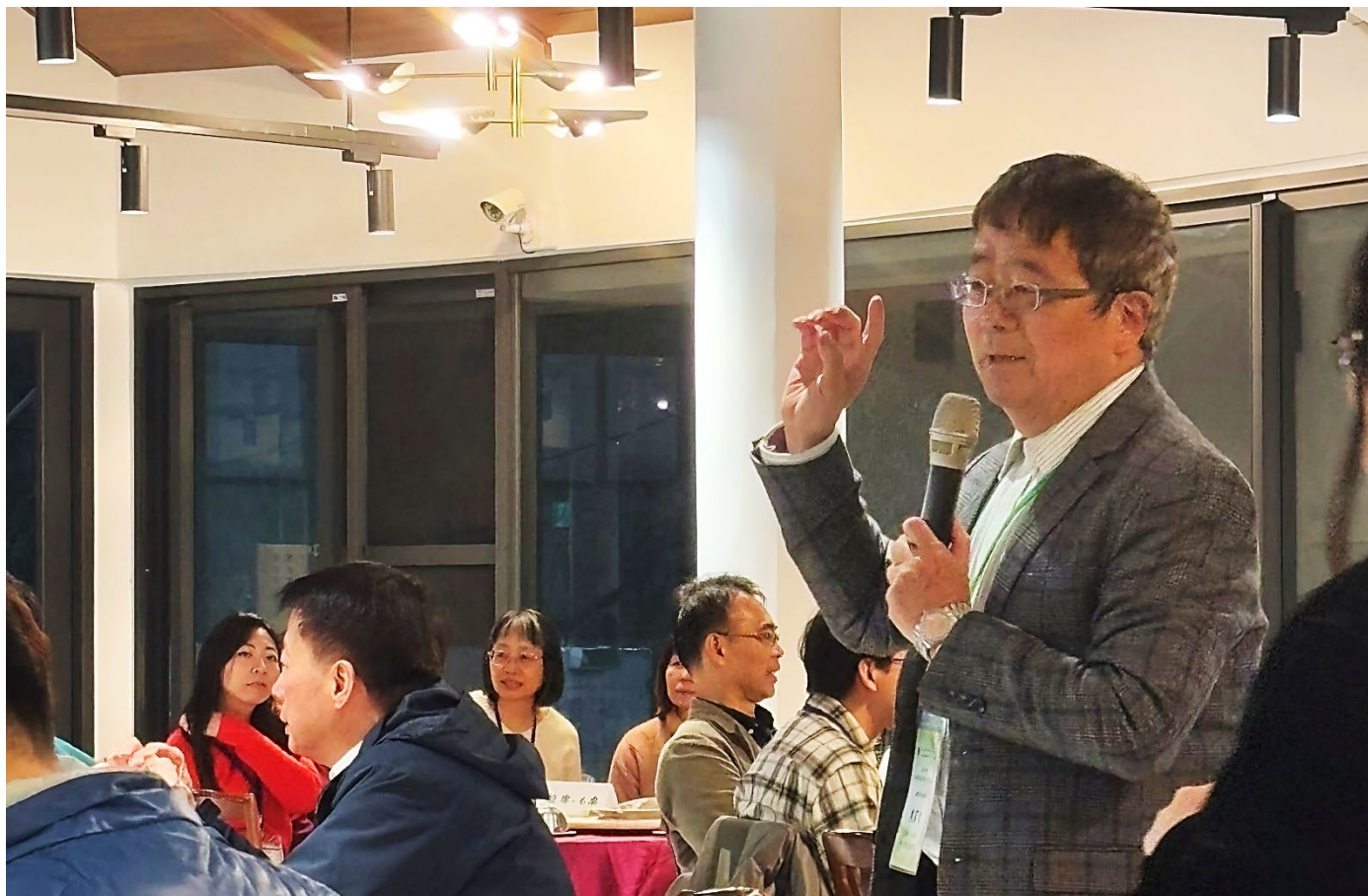
晚餐致詞：國立中興大學 詹富智校長