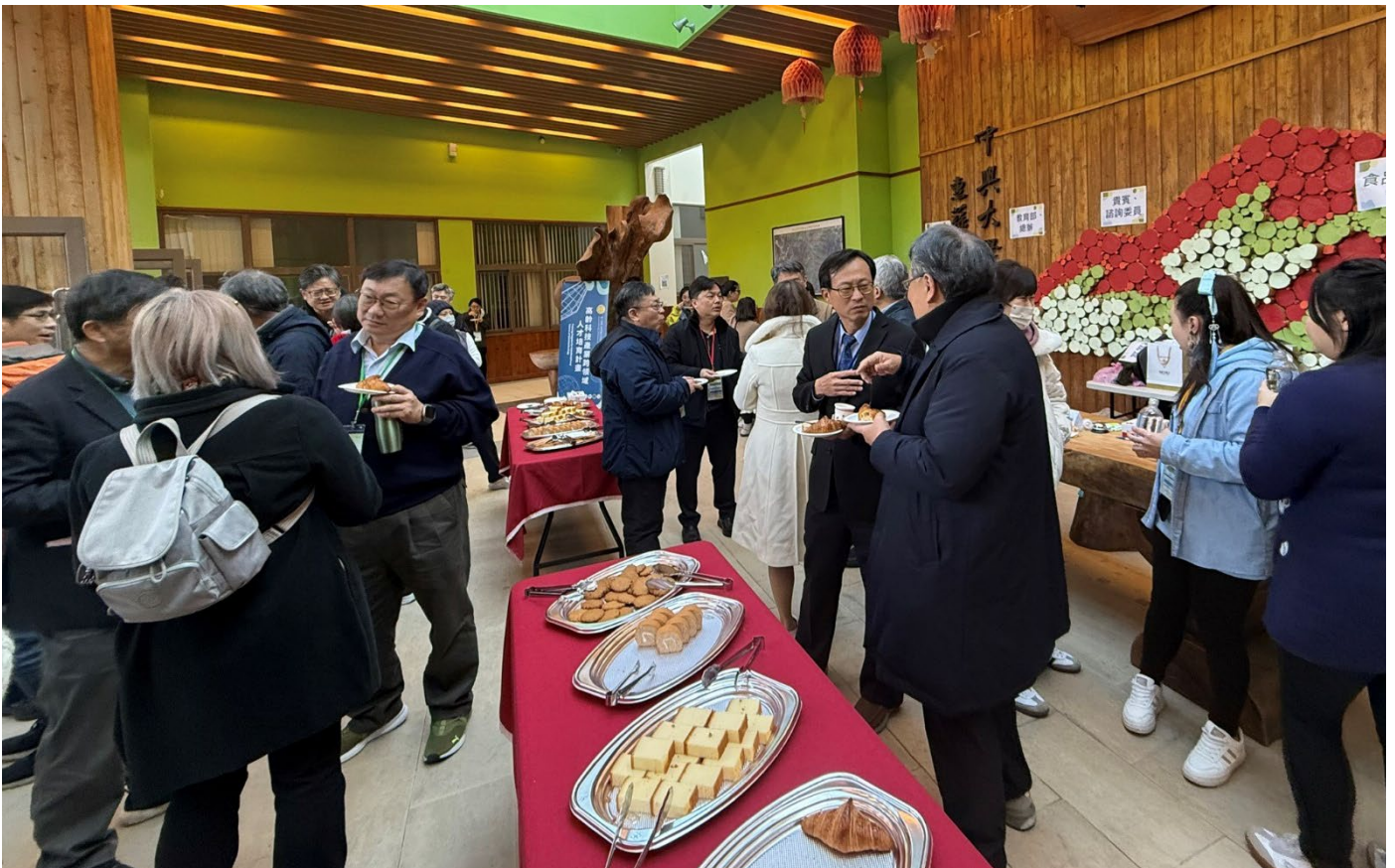
第一天休息時間茶點(會議中心)