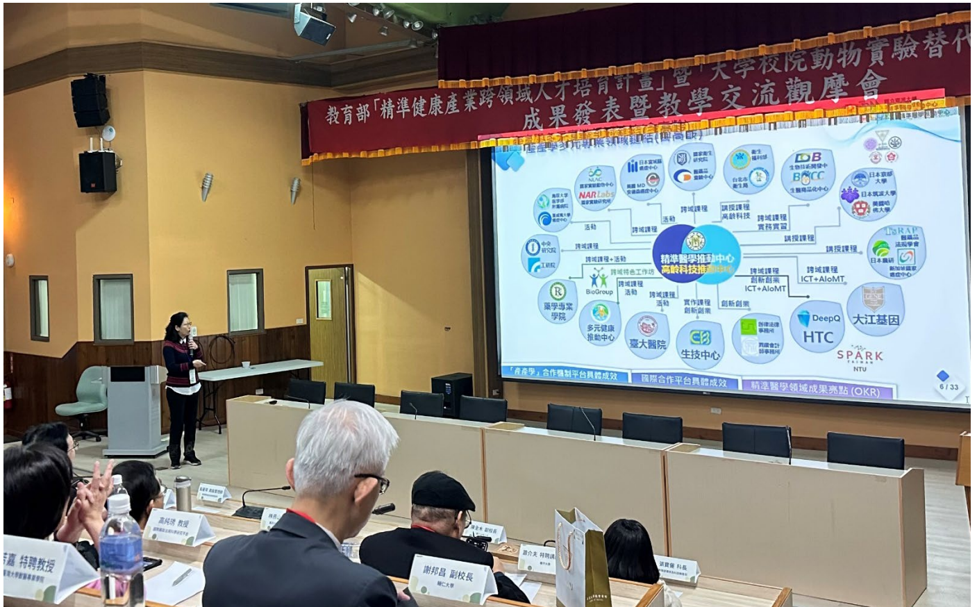
精準醫學教學推動中心：國立臺灣大學醫學院 沈麗娟副院長