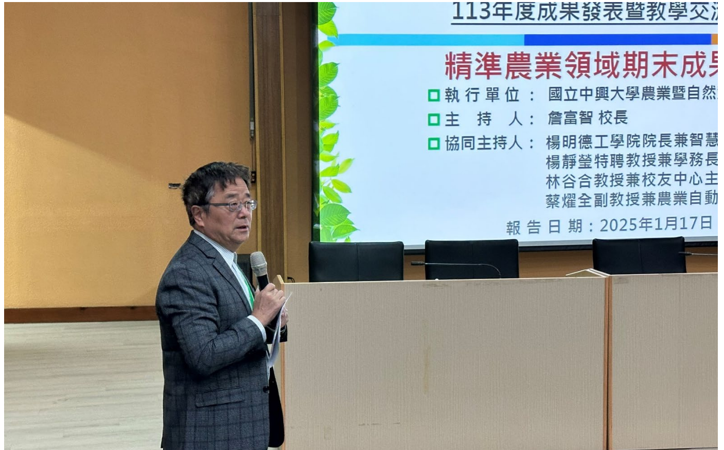
精準農業教學推動中心：國立中興大學 詹富智校長