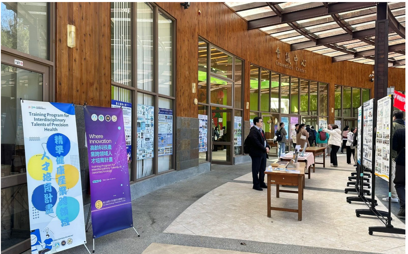
會場佈置(會議中心)-海報及教材