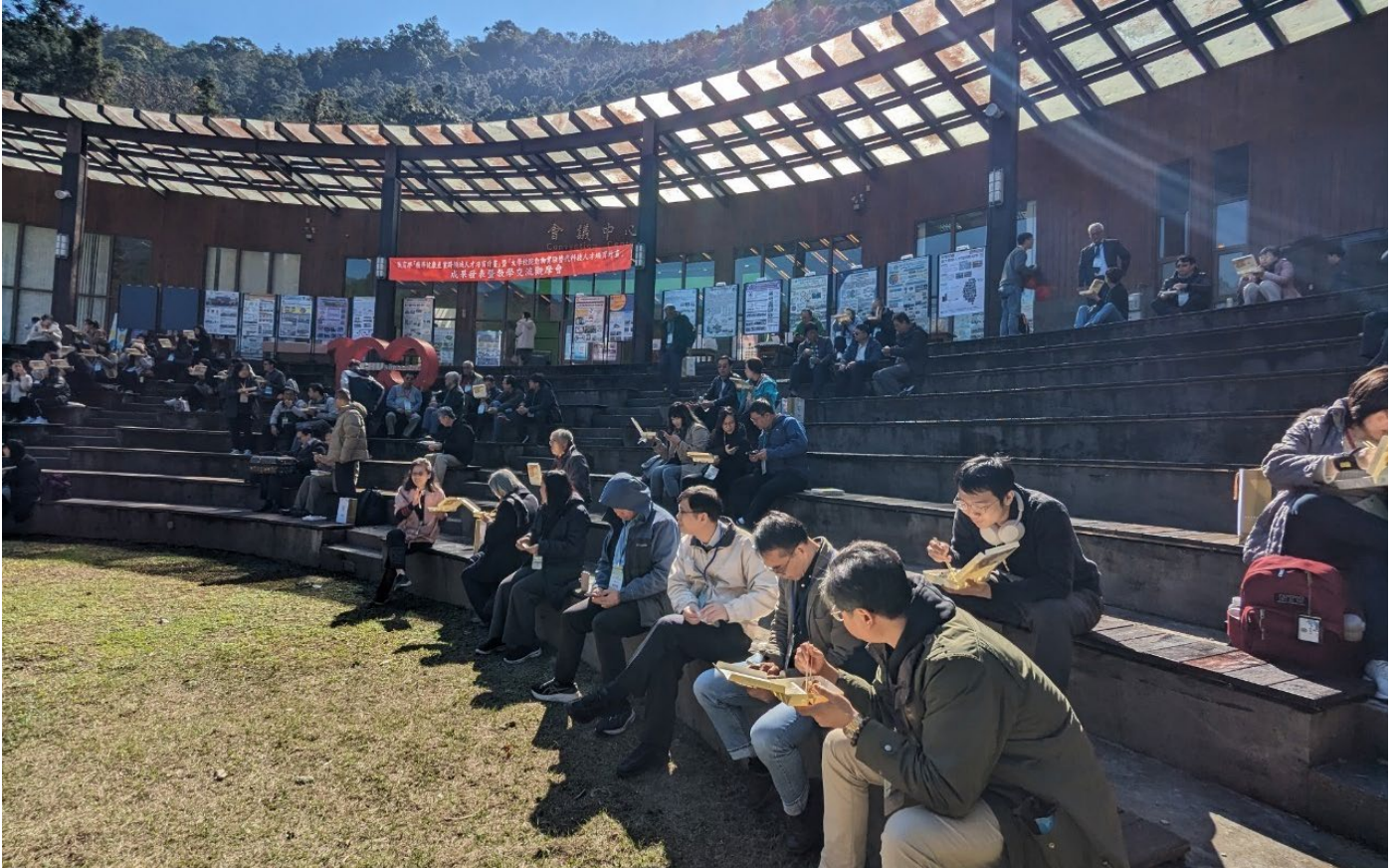
第一天午餐(會議中心外廣場)