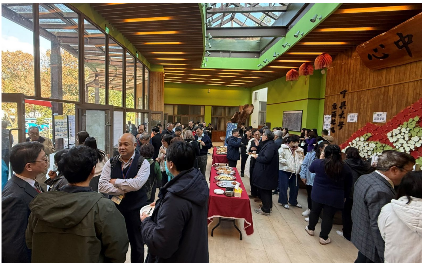
貴賓及師長們享用茶點