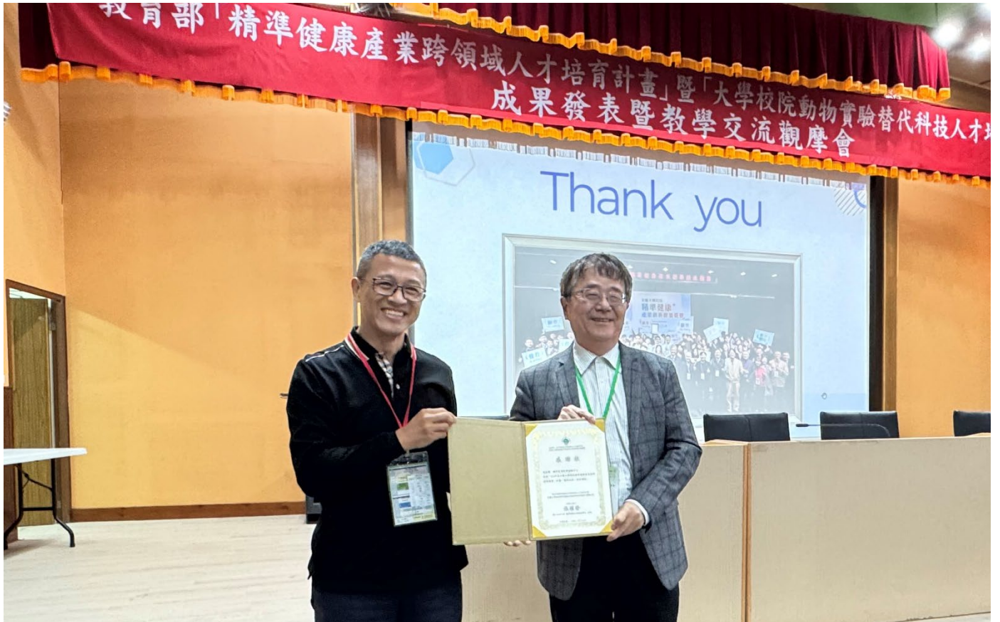
表揚精準農業領域教學推動中心：國立中興大學 詹富智校長