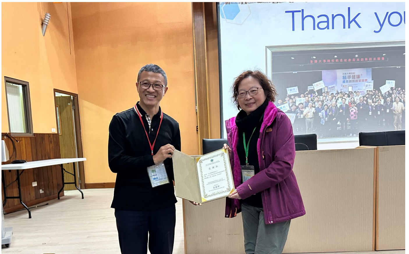
表揚多元健康領域教學推動中心：國立臺灣大學生農學院（臺大食科所羅所長代領）