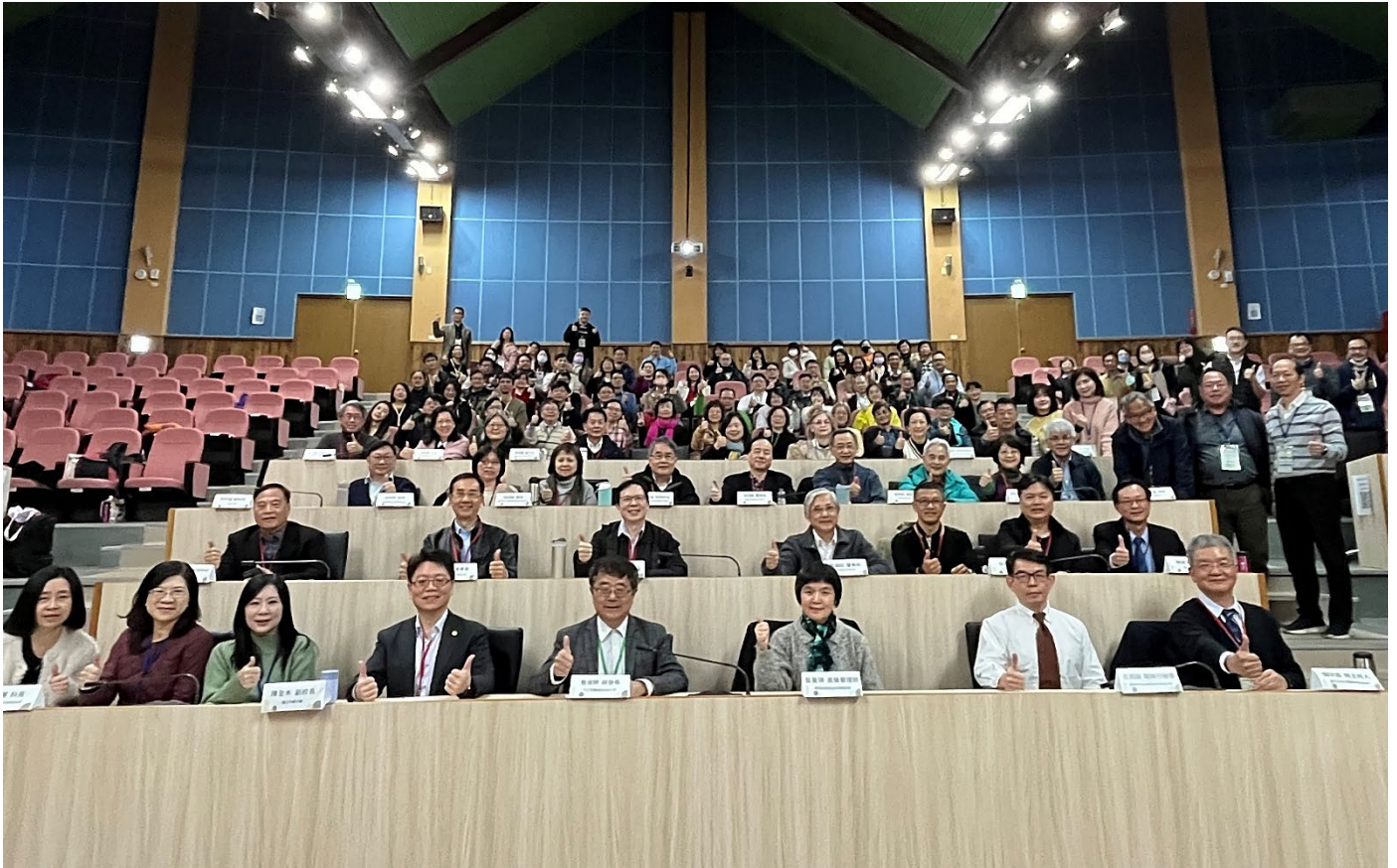
會議中心場內大合照