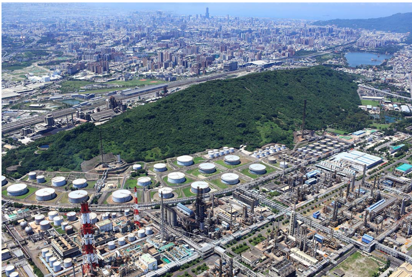
中油高雄煉油廠位於半屏山北側。

根據報導，位於楠梓區後勁的台灣中油公司高雄煉油廠即將在今年11月全面停爐關廠。在1990年，為了化解當地人對於五輕（第五輕油裂解廠）的強力反彈，政府在向當地人承諾，25年之後保證遷廠，還給後勁人潔淨的家園。然而，從五輕動工與運轉以來，官員曾多次試圖翻案，用轉型成「高科技石化園區」的名義，延續煉油廠的生產。也曾有當地民代提議採用「公投」，試圖幫中油公司「解套」。