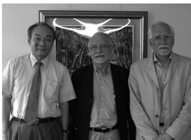
與中研院王汎森副院長合照