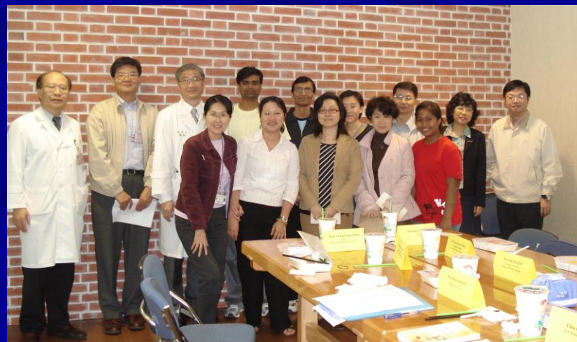
辦理外籍生座談會