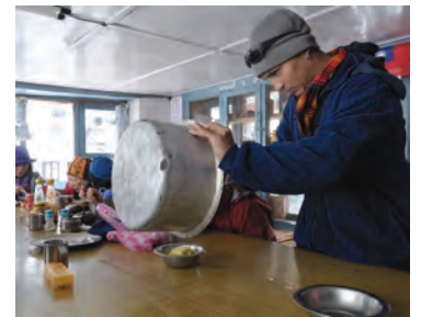
在安那普那基地營山屋裡享受泡麵

尼泊爾是個窮國家，平均每人國民所得（per capita national income）不到台灣的 5%。意思是說，一個尼泊爾人每天工作 8 小時，每星期工作 6