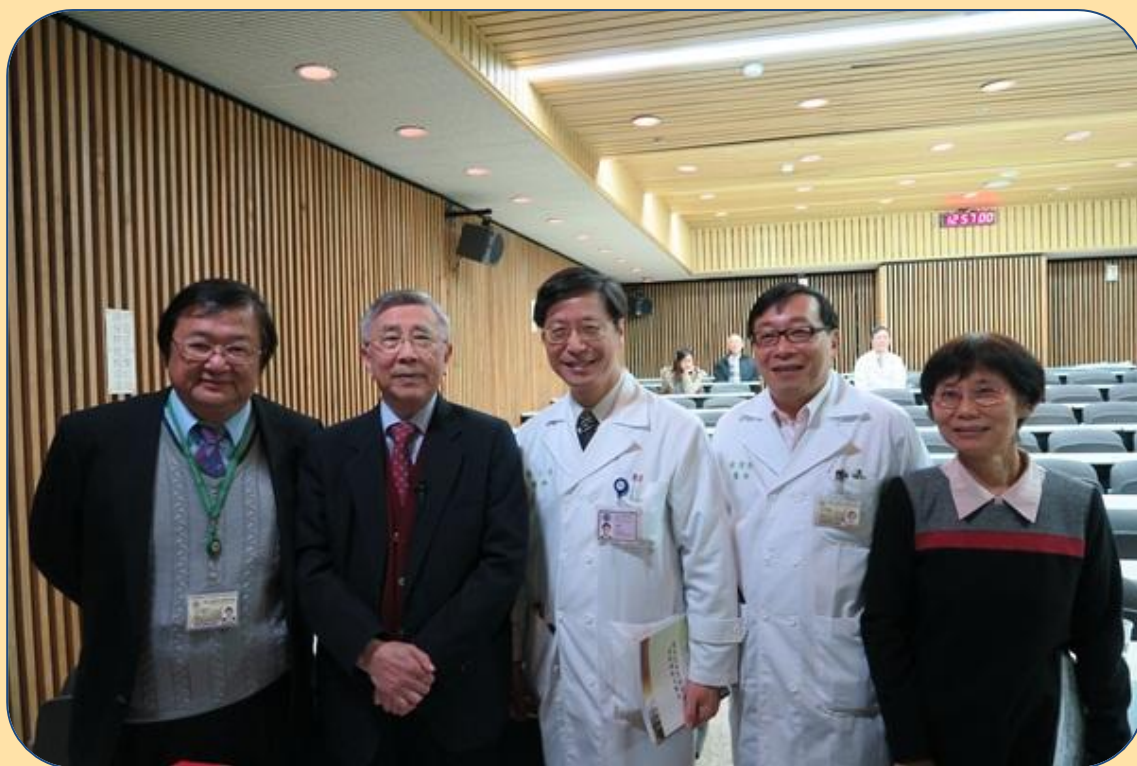
家醫科邱泰源教授(左一)、李明亮教授、臺大醫學院張上淳院長、楊偉勛所長、藥理科 陳青周教授(右一)