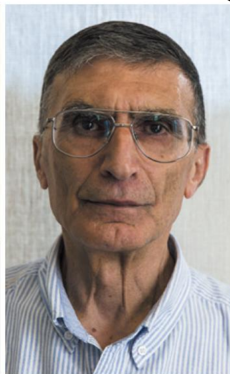
Tomas Lindahl, Paul Modrich and Aziz Sancar share the 2015 Nobel Prize in Chemistry.