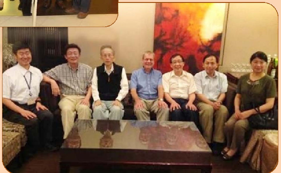
國內外講員 之交流