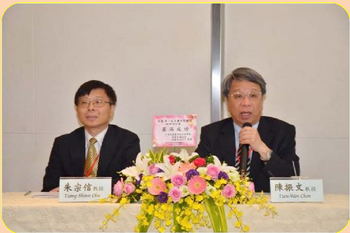
各大醫院腎臟專科權威擔任主持人

總括而言，本研討會全天的活動順利且圓滿地結束，事後更有多位醫師向本團隊表達感謝及支持本團隊學術研究的意願。希望本團隊於不久的將來可發表更多有關多囊性腎臟病的研究成果。