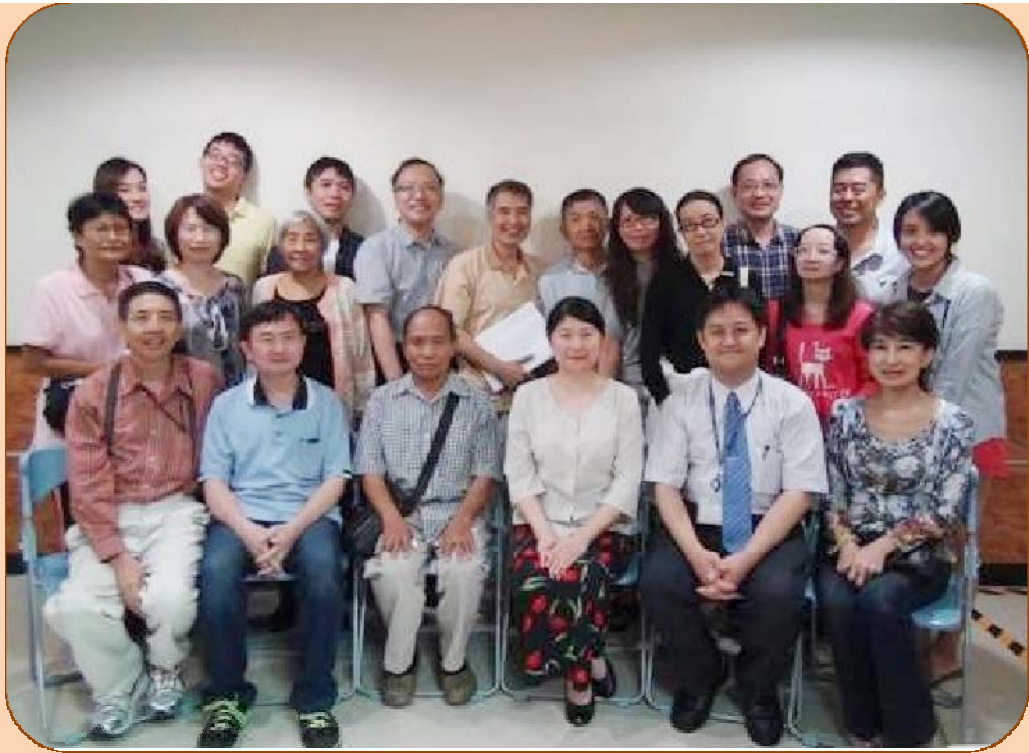
中華民國多囊腎腎友協會發起醫師和腎友合照