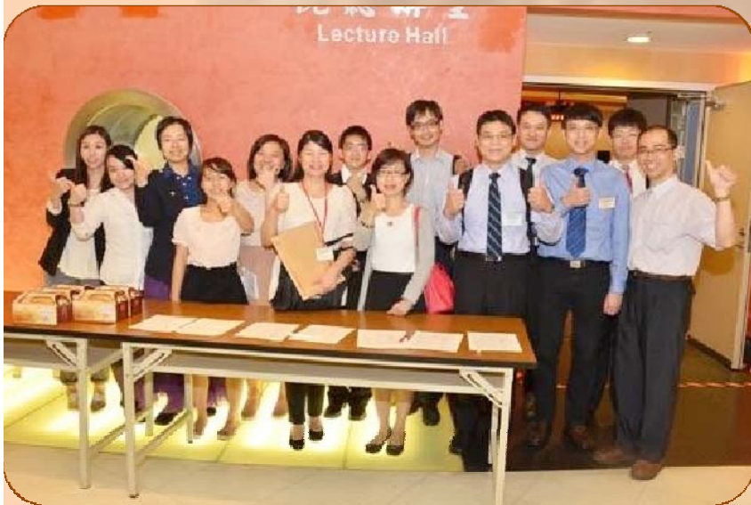
研討會當天之工作團隊