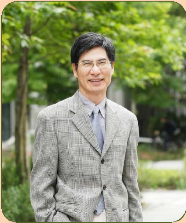
陳良基教授 台灣大學學術副校長

這一陣子，論文假審查的事件仍不停延燒，對學術界的衝擊持續著，三不五時就會接到各大報記者打來詢問各類問題。由於台灣是個淺碟性社會文化所致，一些表面性質的問題，反而常會引起更多討論，許多其實都非學術研究的常態，學界也該有足夠的反省能力。然而，目前所見討論議題大多仍在枝節或個人行為上，我覺得我們更該從根本想起，教育的初衷到底是甚麼？教育的目的又是甚麼？我在台大學術副校長網頁寫下”學副的話”是這樣說：「大學是追求真理的殿堂，他的使命在於創造與累積知識，以造福人類。大學應提供學生能發揮創意的學習環境，讓學生未來能以知識、能力、態度、視野來提升人生意義，創造社會價值。」這到底只是過於理想的空話，還是我們教育工作者該全力追求的？