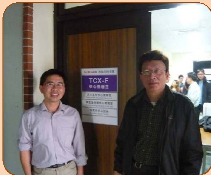
斑馬魚核心設施參觀