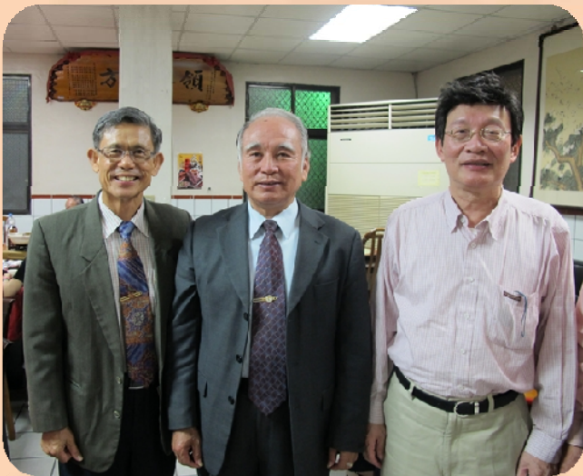
在餐廳與金門副縣長和議長