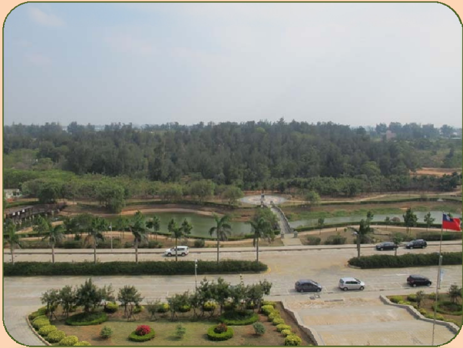
像似國家公園的美麗風景