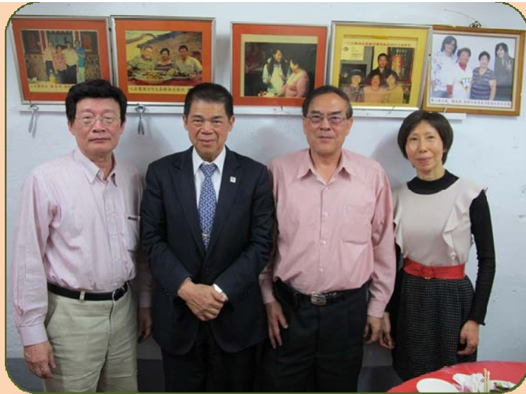
和金門大學校長(左二)相談甚歡