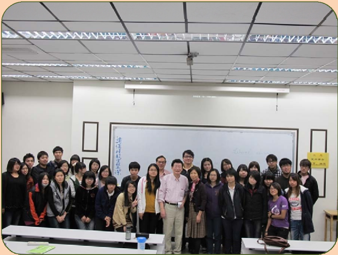
2012年11月7日 演講過後合影