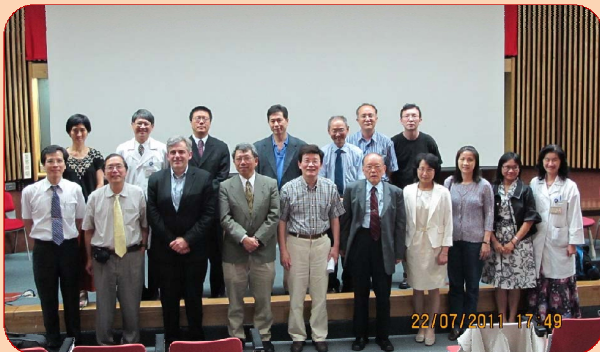
感謝各位大人物的共襄盛舉