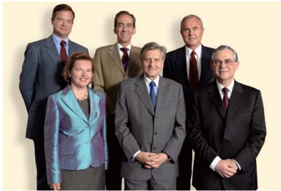
Governor, Bank of England Mervyn Allister King