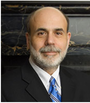
President of ECB Jean-Claude Trichet