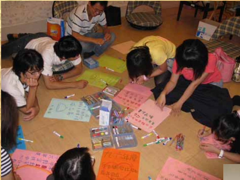
大專青年成長團體課程