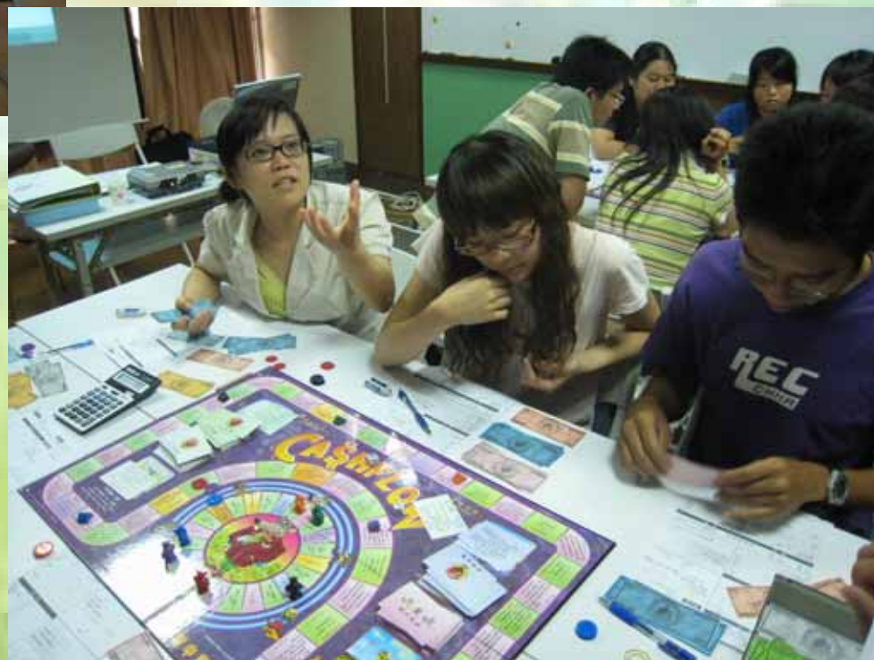
大專青年參加工財規劃課程