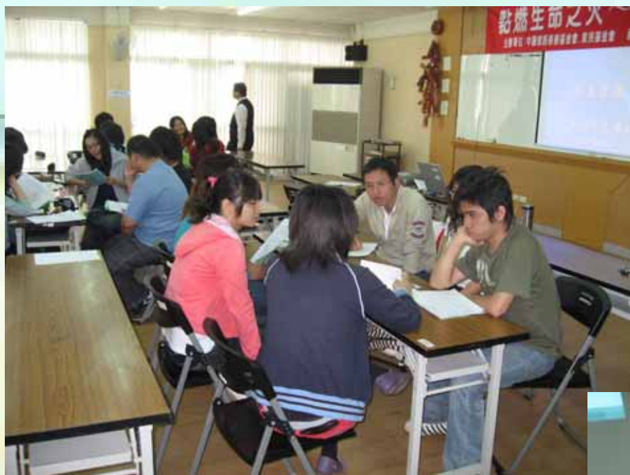
大專青年參加方案招募說明會