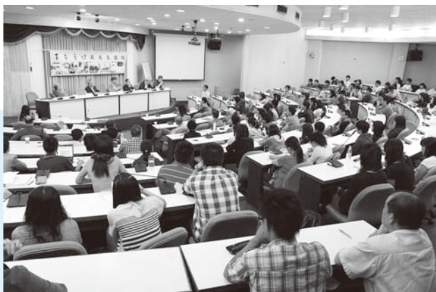
▲紀錄片在政治系國際會議廳首映並舉辦「百年之悟與兩岸關係」研討會

答： 這是另一種史觀，認為從荷蘭、明鄭、滿清、日本乃至於國民黨，都是外來政權，中