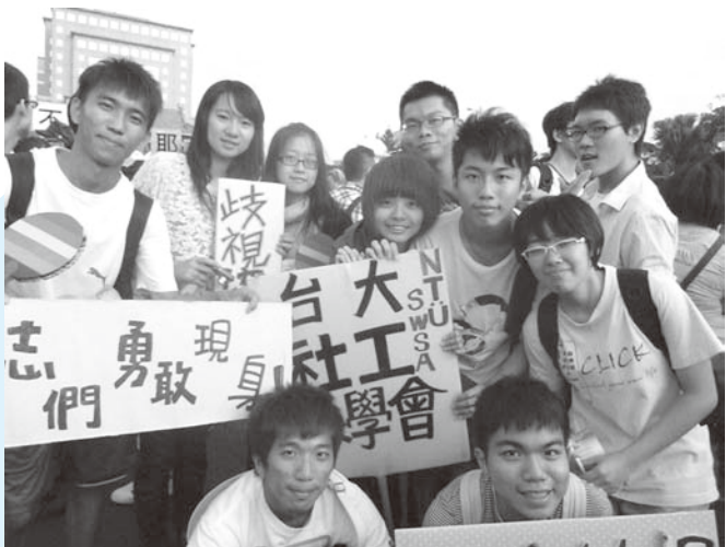
▲社工系同學遊行中合影