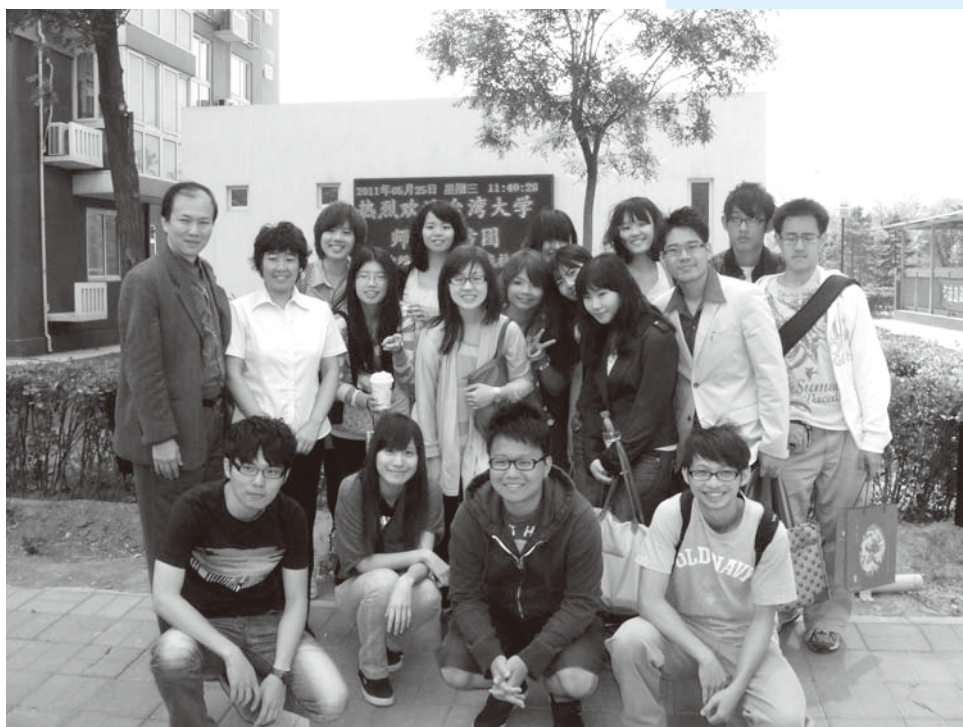
▼政治系同學拜會豐台區蘆溝橋街道辦事處

兩名學生雖然從不同的面相觀察現代中國，但都認為收獲良多，非常推薦政治系學弟妹參與此活動。2012年訪問團的報名訊息，可逕洽政治系辦。