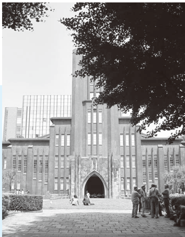
▲東大校園著名的建築安田講堂，為進行畢業典禮與舉行公開演講的場地