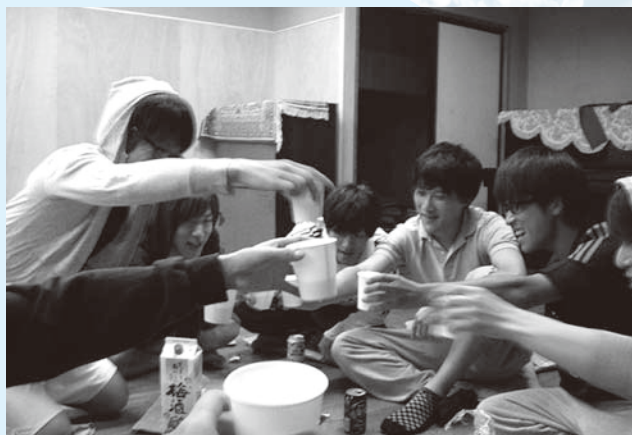
▲日本的喝酒會文化在社交活動中具重要角色，學生私下聚餐幾乎都會喝酒