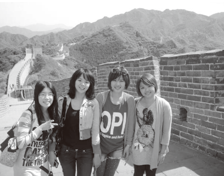
▲政治系同學參觀長城八達嶺段

此次交流中，黃彪特別關注當前「中國式民主」的發展，他從托克維爾的理論概念耙梳，認為美國的民主經驗，不見得完全適用現代中國。必須多方考慮，才能夠為「新時代崛起中的中國」和「亞洲的新興民主國家」找到合適的民主方法與道路。黃彪同時認為解決兩岸問題需要更多的信任，「信任能夠化解誤判，減低衝突，從而避免戰爭，製造雙贏」。