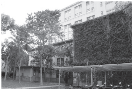
▲滿牆的藤蔓，常讓大一剛入住的舍胞以為男十六舍是鬼屋