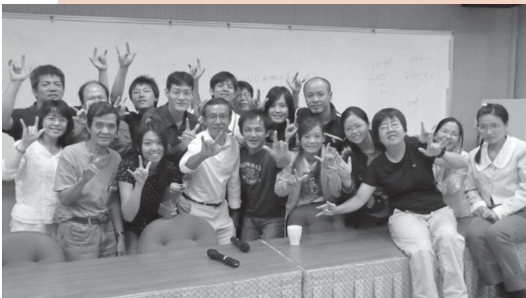
▲吳念真與全臺首批聽語障製播培訓班學員合影

演講最後，吳念真建議有志從事編劇的同學，可以練習如何將抽象概念具象化，思考如何用畫面表現「酷熱」、「欲望」、「分手」等概念，盡量發揮想像力，可先從將小說改寫成劇本開始。