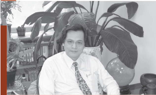
▲回首從政之路，陳明通不留戀也不後悔

「從政不是我的志業，教書、學術研究才是」，臺灣大學國家發展研究所教授陳明通說。卸下行政院大陸委員會主任委員一職，他重返臺大校園，回到最熱愛的工作崗位。回首過去從政之路，陳明通不留戀，也不後悔。