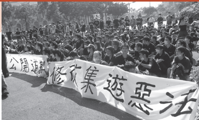
▲數百位學生透過網路串連，11月6號早上至行政院門口靜坐