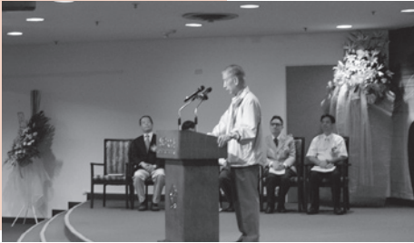
▼孫廣德教授演講現場