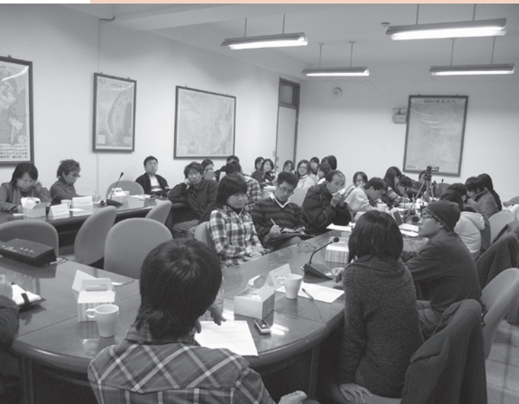
▲社科院師生齊聚一堂，討論社會科學知識與實踐的關係