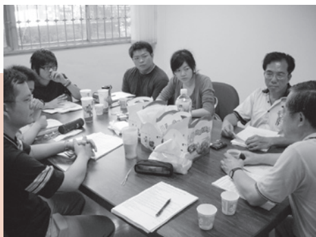
◀社科院學生經營讀書會很認真（圖／法社學務分處 提供）