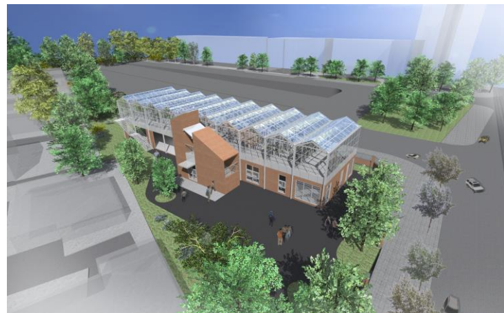
建築造型、色彩呼應校園既有建築