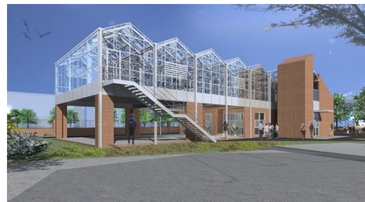
臨宿舍區立面採用隔音百葉，降低對宿舍區噪音干擾