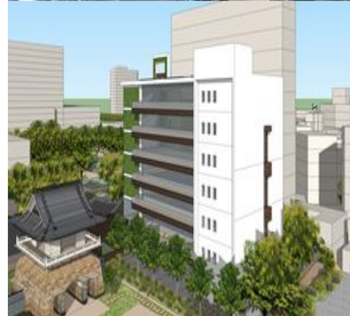
基地南側與市定古蹟鐘樓相鄰