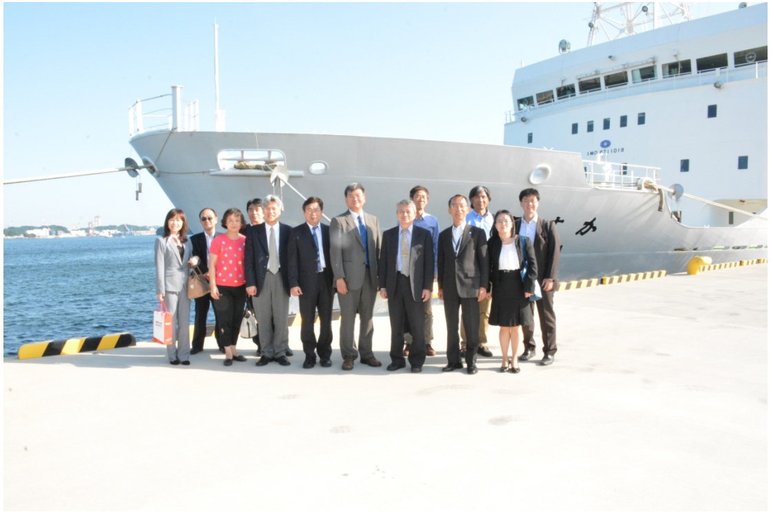
圖三、參訪團隊於 YOKOSUKA 研究船前合影

因此在 JAMSTEC 晚宴結束前，本人謹代表台灣一行人除感謝日方熱忱接待外，特別期望未來台日雙方之海洋研究可長可久，友誼永存。