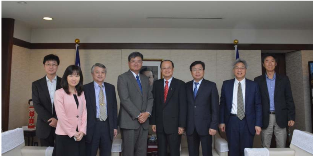
圖四、科技部錢宗良次長率隊拜會我國駐日大使沈斯淳