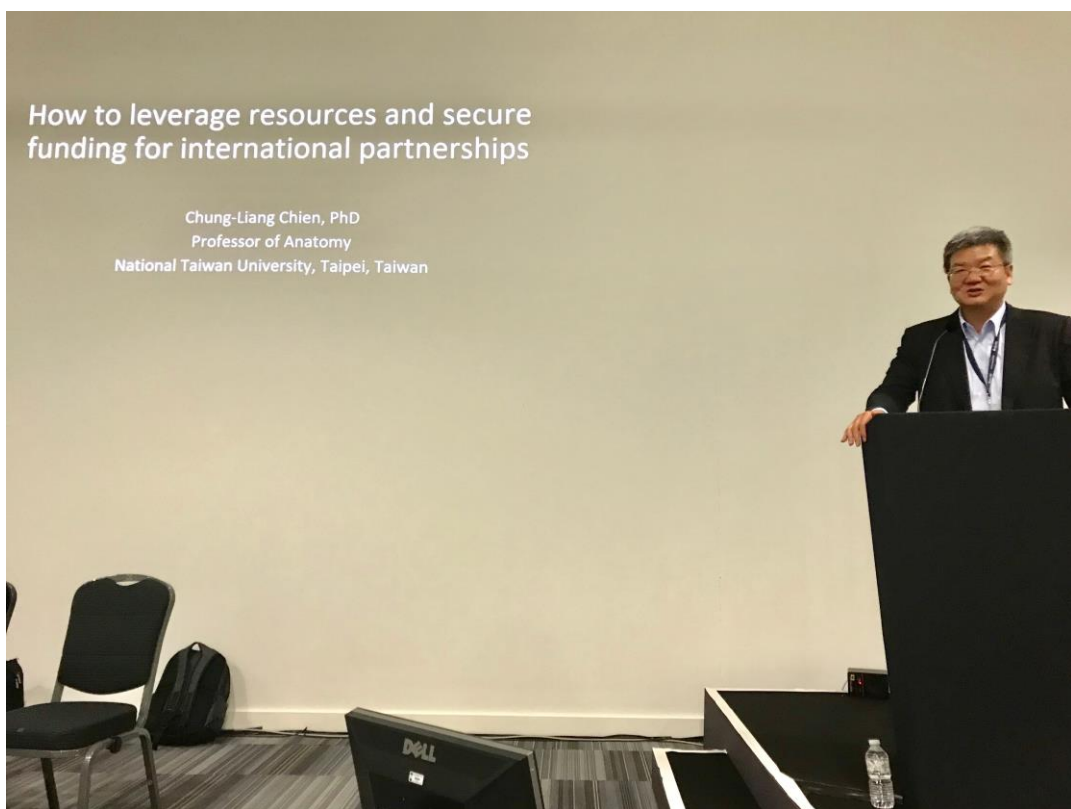
圖七、我的演講題目 “How to leverage resources and secure funding for International Partnerships”。