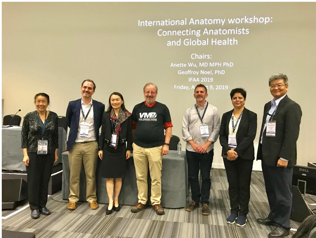
圖六、International Anatomy Workshop 研討會講員合影。