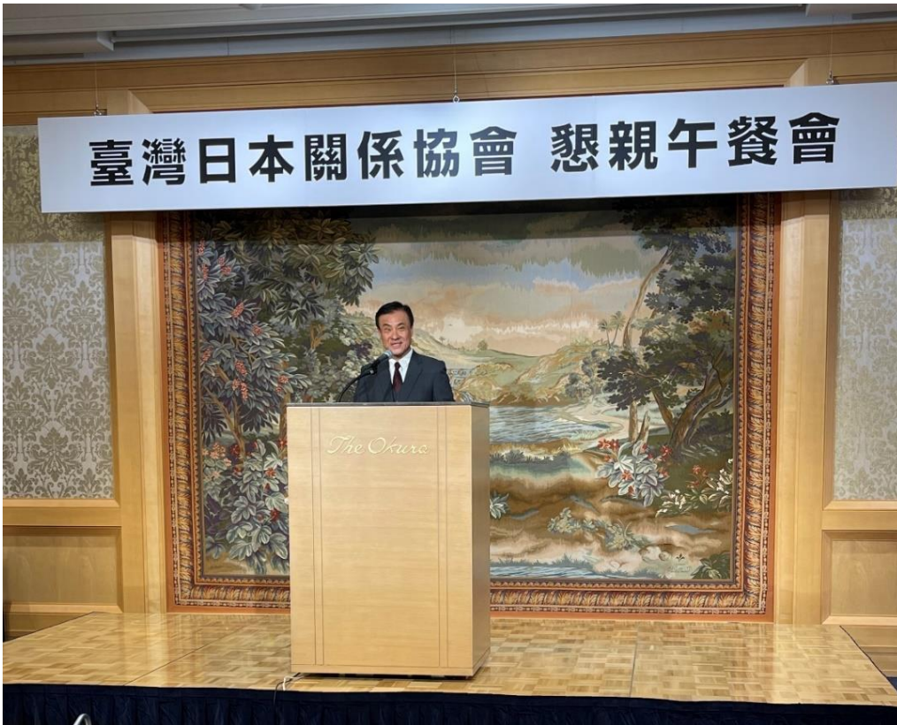
臺灣日本關係協會會長 蘇嘉全 致詞