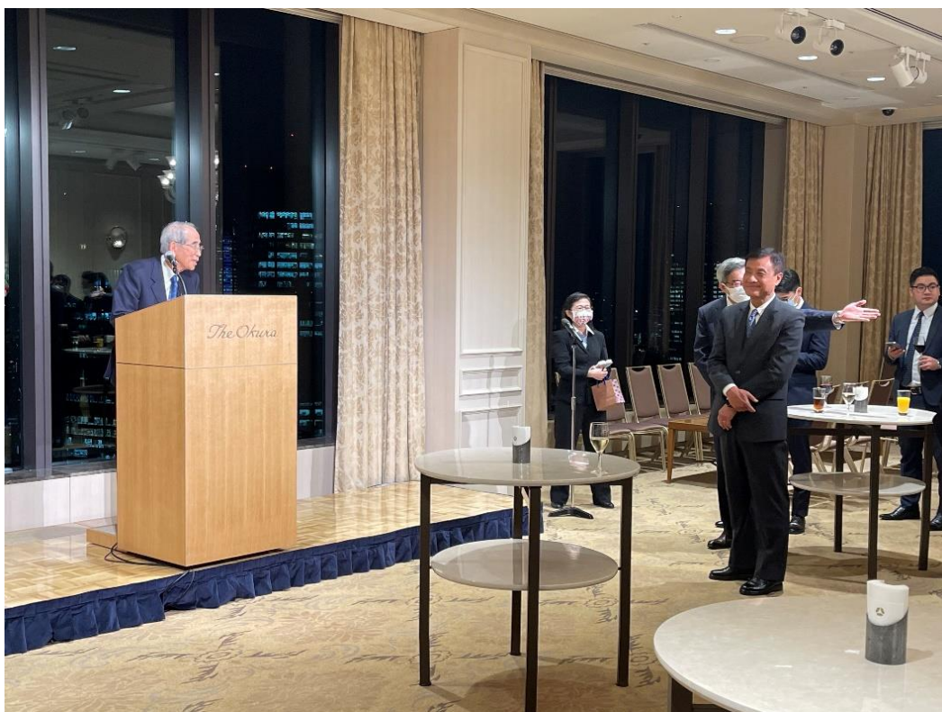
日本臺灣交流協會會長 大橋光夫 致詞