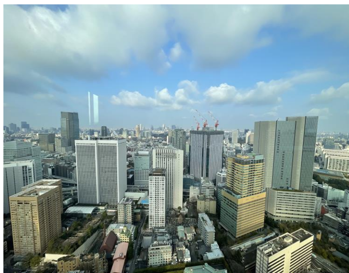
第5屆台日第三國市場合作委員會地點大倉飯店 41樓 lune 外景。