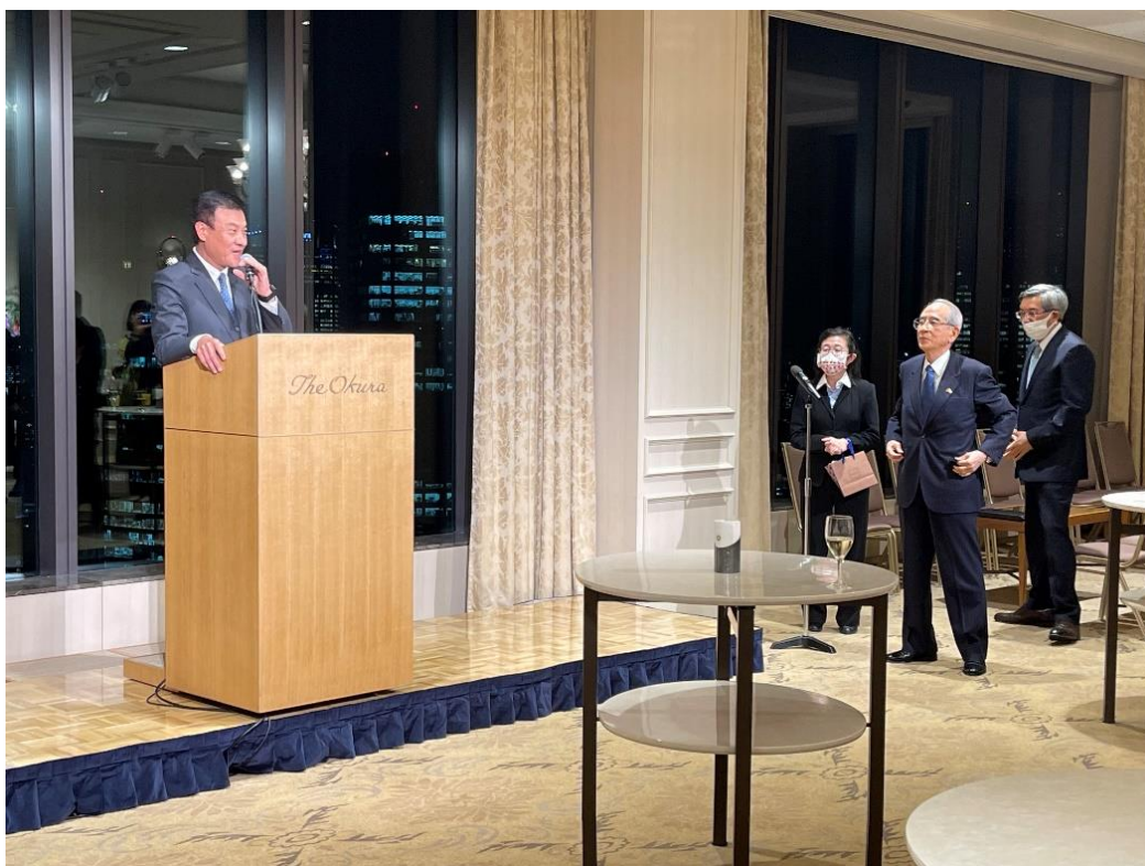
臺灣日本關係協會會長 蘇嘉全 致詞