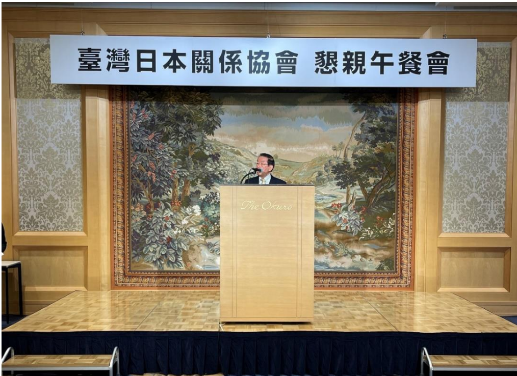
駐日代表處 謝長廷代表致詞