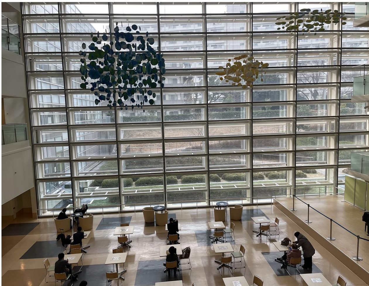
國際醫療研究中心附屬醫院大廳