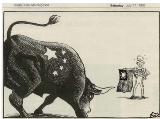
Fig. 1. SCMP, 17 de julio de 1999