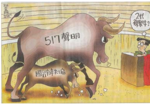
Fig. 4. (izquierda) ZS, 15 febrero 2004