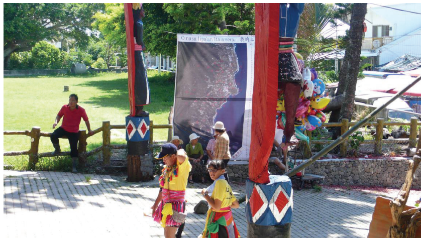
圖 9 以 Google Earth 重繪之都蘭傳統領域地圖