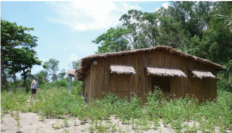
圖 5 都蘭遺址上方之聚會所

關於前述的舊社尋根, 另外有個同在阿美族部落發生的插曲可供參考。筆者在長濱鄉進行訪談時, 得知當地部落青年提議進行舊社的尋根之旅, 希望能帶國小學童一起上山體驗早期生活, 然而部落耆老卻有不同的意見, 不少人主張要先跟「老人家(指祖先)」溝通, 但對於如何溝通卻沒有太多建議。直到尋根之旅當天, 社區發展協會總幹事到了