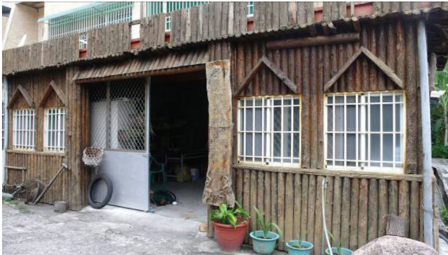
圖 7 都蘭阿美傳統領域暨生態保育促進會