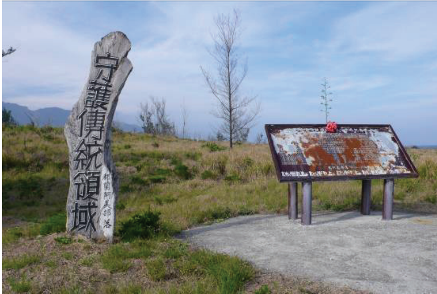
圖 2 位於都蘭鼻 Pacifalan 的「守護傳統領域」立柱與「阿度蘭傳統領域暨登陸滄桑紀念碑」（羅素玫攝於 2008 年 4 月 5 日）