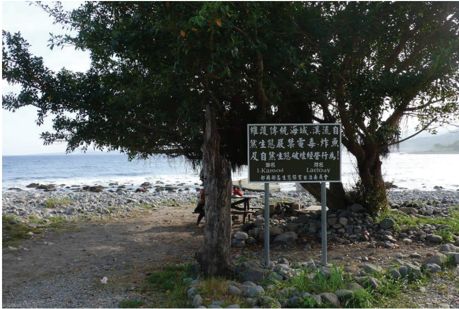
圖 6 加母子灣 (Kamod) 告示牌 (羅素玫攝於 2008 年 4 月 5 日)

嘯全村覆歿，因此部落從 Pacifalan (都蘭灣) 遷移至地勢較高 Ciwuwayan (都蘭林場)，族人向列祖列宗宣告土地自然主權，願上帝保佑阿美族子子孫孫直到永遠。