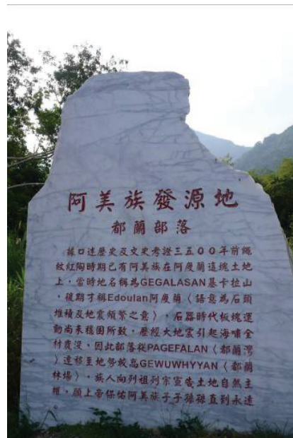
圖 3 都蘭遺址旁之阿美族起源石碑