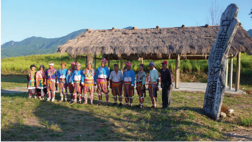
圖 4 位於都蘭鼻 Pacifalan 上的聚會所 ( taloan )