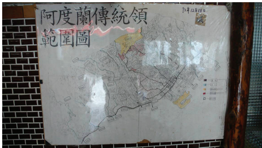
圖 8 都蘭傳統領域地圖

和文化工作者選擇的主打項目；抑或是在新的政治經濟勢力進入後，如何與原先部落內部權力關係互動並產生變化，都值得後續長期地關注。另外在都蘭部落生態環境上所引發的權力問題，應不只發生在當代，過去日本人與漢人移民帶進新的農耕技術與作物(稻米、甘蔗、香茅與鳳梨等)，在當地紅糖廠建廠後，以及民國四十年左右大量漢人開始移入之後，應該都有過改變。這中間牽涉到更複雜且值得進一步探討的人與環境間觀念與儀式的變遷、文化與族群認同的不同形貌與階段意義、族群關係的改變，以及環境的政治經濟學之面貌等等的問題。