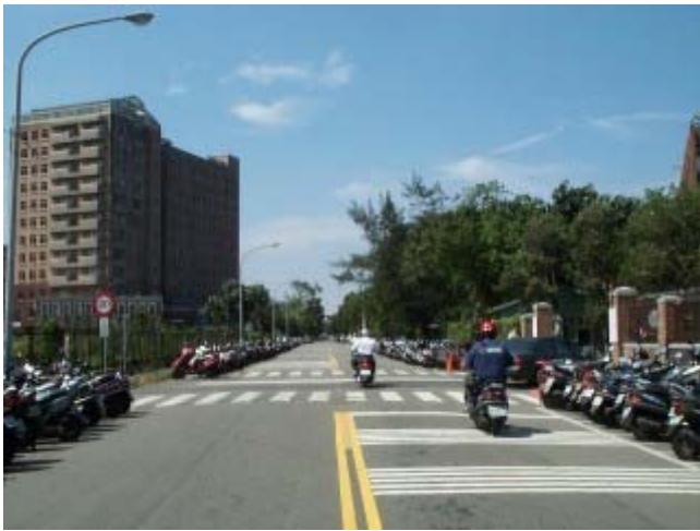
圖 5 民國八十九年舟山路景象