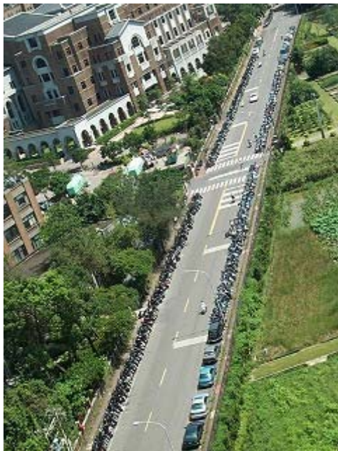
圖 2 民國八十八年舟山路空拍照片

舟山路上第一個改善成果－鹿鳴廣場，就在民國九十一年四月落成，是第一個永久的改善目標。九十二年初夏，鹿鳴廣場旁的小小福空間也完成了近期改善；在九十二年秋天完成了水工所至圖書館段的改善，配合瑠公圳復育計畫和農場合作，亦在舟山路旁、農場邊完成了水源池；今年九十三年春天，圖書館至生機系段及生命科學館段也順利改造完成，整條舟山路的環境改造工作可謂已完成一半以上。其後在二年的時間內，完成了舟山路沿線一半以上地區的翻新。就像最初提案的「綠色生活廊道」構想一般，整條舟山路沿線植樹綠化，是個隨處歡迎行人停留的人性空間。