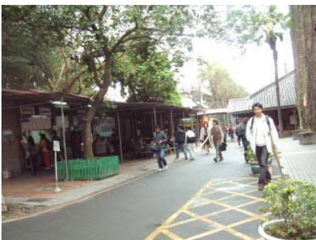
圖 7 民國九十一年，小小福原貌

在充實生活服務機能的方面，重心放在改善現有的小小福及鹿鳴堂地區。本來計畫中的鹿鳴堂原地改建中央餐廳的構想，因預算問題無法推動，因此近期改以實質改善小小福的環境品質為目標。過去小小福擁擠又衛生不佳，為此小小福和旁邊的倉庫皆來了次大風吹，並拆除現地違建，重新安排小吃部及福利社的空間位置，把小小福原來的所在地，騰出做為可遮風避雨的半開放用餐空間，並設置戶外小廣場，讓大量的上下課學生不再塞在狹窄的柏油路上，簡單的植栽設計和坐椅、燈具，原本失去功能的警衛亭改裝為咖啡屋，讓小小福「鹹魚大翻身」，從以前路邊攤的形象，搖身一變成為拍婚紗的景點，和鹿鳴廣場相互對應。當小小福外的燈具點亮的第一夜，有位同學正好騎著腳踏車從同事身旁而過，他唸著「怎麼搞得這麼浪漫？」，引來同事們一陣帶有虛榮感的竊笑。雖然施工和協調的過程中各方難免有情緒化的時候，但相信一切努力都很值得。