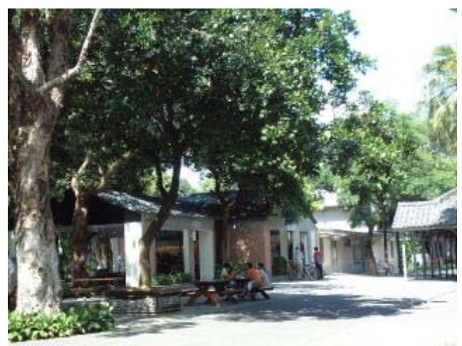
圖 8 民國九十三年，小小福同一地點景觀