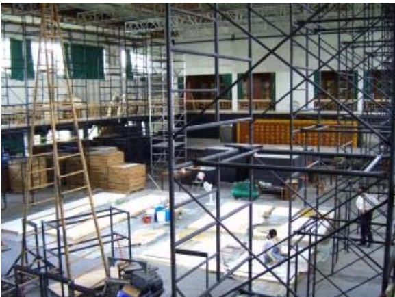
圖4 鹿鳴堂二樓「臺大劇場」

原蘇航餐廳業者業契約到期結束營業後，乃將一樓全部空間(約 388 坪)委外經營，採委外模式引進民間專業及資金，改善一樓硬體，引進更多元服務，以因應日增的鹿鳴廣場人潮，及未來戲劇系搬至鹿鳴堂二樓後所帶動本區之各項生活需求。鹿鳴堂一樓的餐飲服務項目，原則上是和小小福相互區隔的，但仍保有部分低價商品，以符合師生的不同需求。委外規劃時為兼顧校內日常用餐及傳統宴席需求，招商業種要求至少應包含平價餐飲、中式宴席，本案於 93.11.5 公開招標，共有 4 家廠商投標，由美德耐股份有限公司得標，共引進鹿鳴宴中餐廳目前進駐的包括鹿鳴宴中餐及素食餐廳、牛筋學院牛肉麵專賣店、7-11 便利商店、DEAR VITA 果汁吧、山崎麵包、羅多倫咖啡簡餐等。這些廠商多為連鎖企業，本校師生員工在此消費均享 9 折優惠，目前已陸續試營運中，94.4.29 前可全面營運。廠商也投入經費改善一樓廁所及公共設施，讓鹿鳴堂不論裡外都能耳目一新。