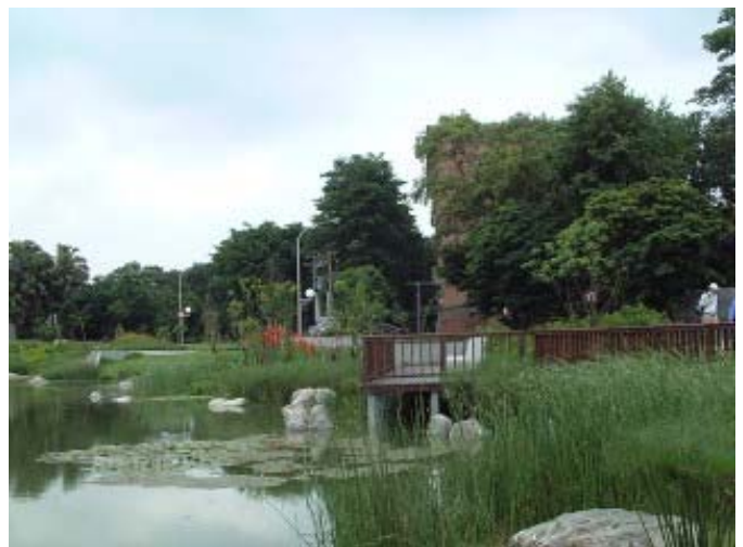
圖 1 2 瑠公圳水源池