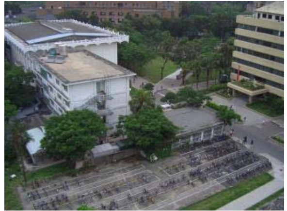
圖6 鹿鳴堂旁邊就有個大型腳踏車停車場，請勿隨意停車以免誤人又不利己！

按後續規劃，未來將有計畫地拓展小小福、鹿鳴堂地區，延伸至管理學院旁荒廢的小教堂，使小教堂成為另一處藝文展演空間，打造舊有的「基隆路四段一四四巷」（即鹿鳴堂至管院教學管之巷道，廢巷前的路名）成為臺大校園的文藝特區。希望藉本次鹿鳴堂及小小福地區的營造案例，能為本校帶來更多的空間創意。