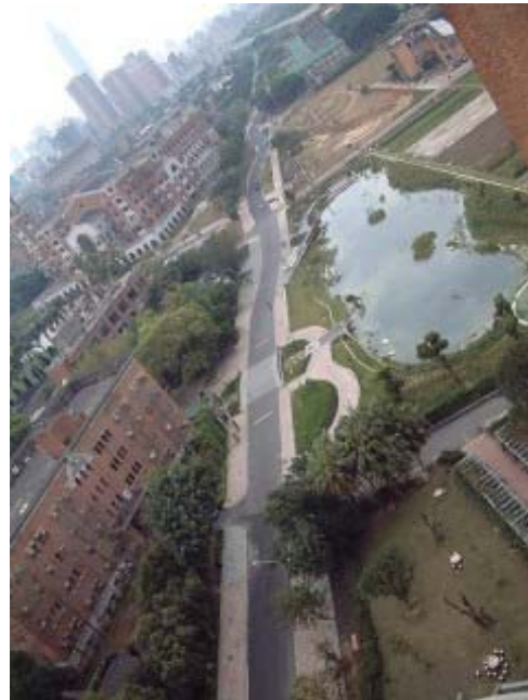
圖 3 舟山路現況