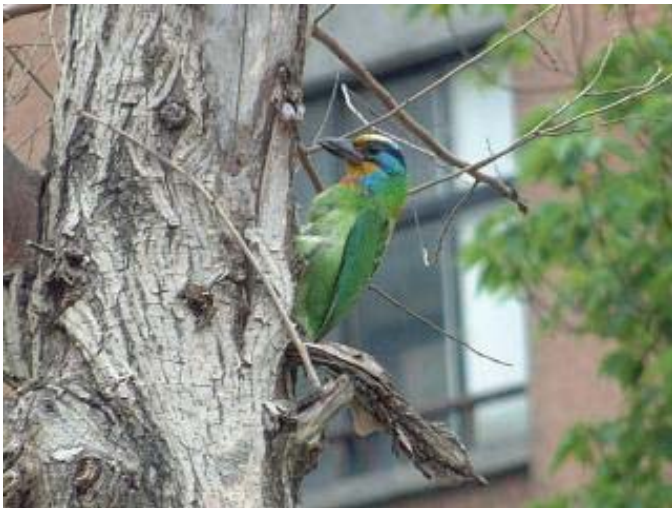
圖 1 3 水源池旁一株水柳枯枝上，連著二對五色鳥前來築巢育雛，許多鳥迷聞風前拍照。

吹播了那麼多，不妨直接撥個午後時分，到地質系庭院欣賞代表台灣各地地質特色的奇石、在小小福廣場喝杯咖啡、向共同教室前的百年老松樹打聲招呼、到鹿鳴廣場享受一下藝術季時學生們的創作、到水源池看看台灣濕地植物和鳥群芳蹤、在圖書館旁的綠樹下，找塊木平台或桌椅坐下，沉澱心情看本好書、眺望重新設計的農場標本園、或在圖書館後面的大草坪上無拘無束地發發呆、在標本園和工科海洋系交會處有個解說牌小廣場，停下腳步想像一下舟山路的古往今來，體驗充滿歷史又活力充沛的校園生活吧。