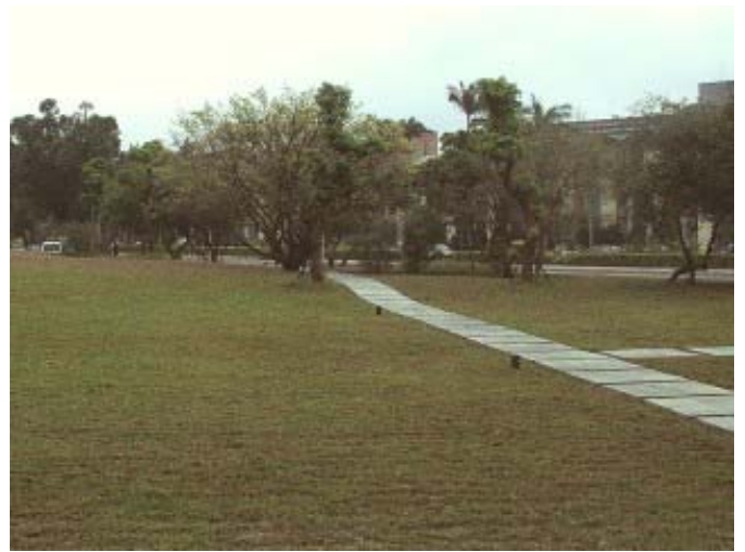
圖 1 4 圖書館後方的大片草地，可以在夜間看星星哦！