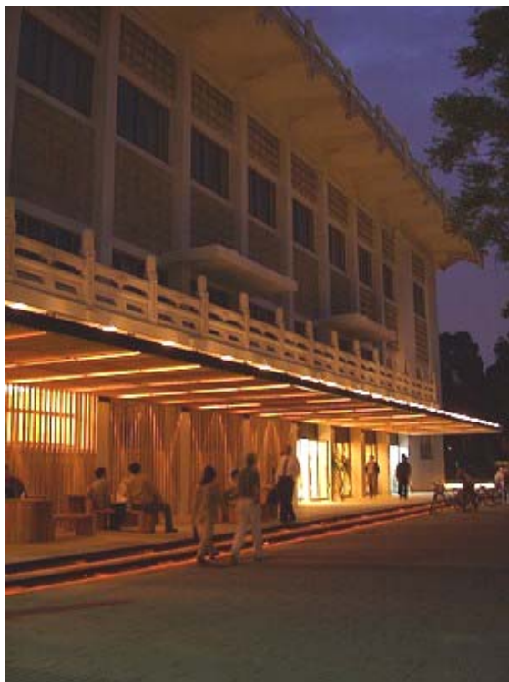
圖 1 鹿鳴堂夜景

鹿鳴堂多年來，一樓為中菜餐廳、會議室、貴賓招待室，二樓則為挑高的禮堂，可供會議或集會使用，又近年學生人數眾多的通識教室，也常借用鹿鳴堂二樓的禮堂來上課，惟皆已老舊。多年來平價的小小福提供便宜的餐點供學生利用、而看似高貴的鹿鳴堂，則是教職員聚餐或宴客的地方：像這樣的印象似乎已經根深蒂固，因此所有的活動聚集在擁擠的小小福，過了舟山路，鹿鳴堂附近就成了嚴肅、喧嘩不得的古板空間，舟山路兩側彷彿是二個不同世界。