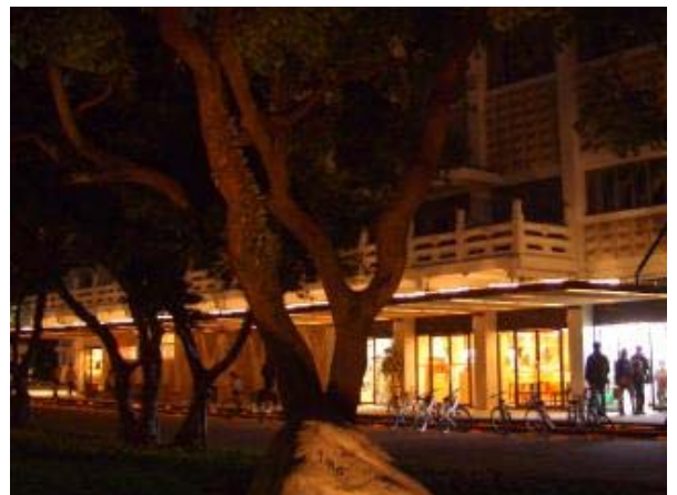
圖7 鹿鳴堂及鹿鳴廣場形塑創意校園空間