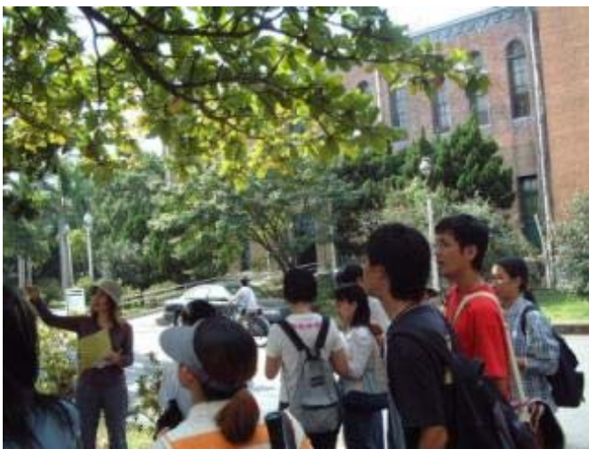
圖 1 1 藉解說活動使師生深入認識校園

和新建工程相較，舟山路從回收起周邊地區環境改善的各項工作及配合工程，不論是臨時的或永久的，迄今花費約三千多萬元，其中包含一千萬來自於瑠公水利會專案贊助水源池之工程配合款，另外二千萬元則來自基隆路拓寬時市府的補償款。相較於館舍新建工程而言，一棟新館舍僅就工程費至少以億為單位，而且使用者與受益者畢竟有限；然而舟山路在四千萬不到的投資中，卻可供全校三萬師生及台北市民共同利用，相信這樣的投資是絕對划算的。