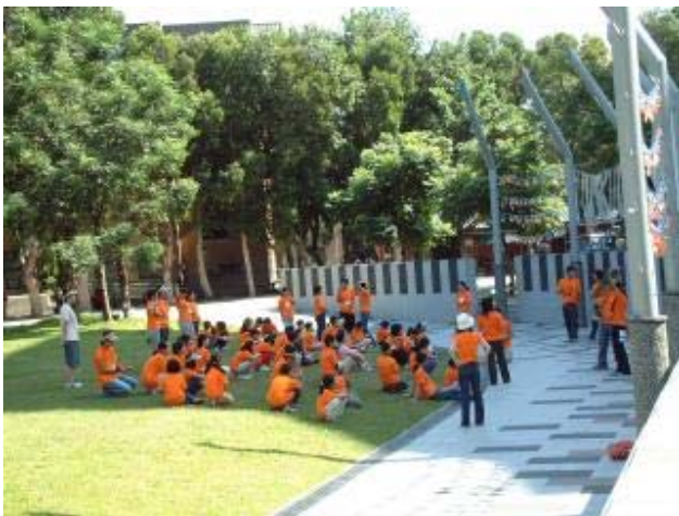
圖 9 鹿鳴廣場上有時可見學生舉辦活動

在長興街校門旁的舊有福華餐廳，即將成爲電資學院電機系新館的建築基地，此新建工程案也將包含舟山路底三角綠地的環境改善，也提供公共設施如小餐廳、便利商店、停車場等，協助解決此地區長期缺乏餐飲及民生購物等基本需求，並配合辛亥路校門與長興街校門連通的長期計畫，塑造新的校門口意象。