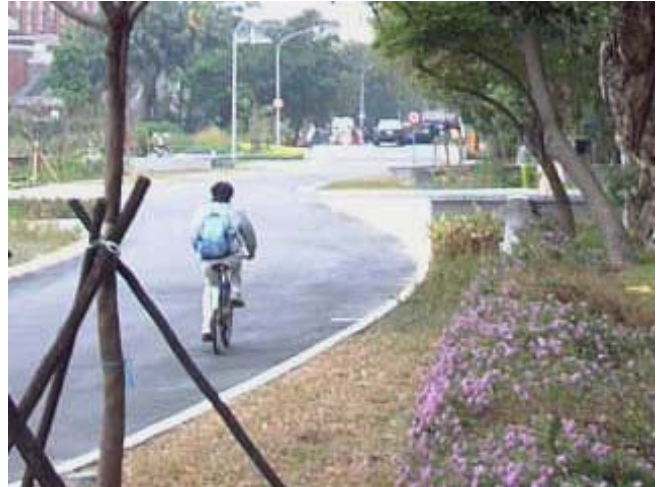
圖 6 同一地點，民國九十三年拍攝的舟山路景象

在充實生活服務機能的方面，重心放在改善現有的小小福及鹿鳴堂地區。本來計畫中的鹿鳴堂原地改建中央餐廳的構想，因預算問題無法推動，因此近期改以實質改善小小福的環境品質為目標。過去小小福擁擠又衛生不佳，為此小小福和旁邊的倉庫皆來了次大風吹，並拆除現地違建，重新安排小吃部及福利社的空間位置，把小小福原來的所在地，騰出做為可遮風避雨的半開放用餐空間，並設置戶外小廣場，讓大量的上下課學生不再塞在狹窄的柏油路上，簡單的植栽設計和坐椅、燈具，原本失去功能的警衛亭改裝為咖啡屋，讓小小福「鹹魚大翻身」，從以前路邊攤的形象，搖身一變成為拍婚紗的景點，和鹿鳴廣場相互對應。當小小福外的燈具點亮的第一夜，有位同學正好騎著腳踏車從同事身旁而過，他唸著「怎麼搞得這麼浪漫？」，引來同事們一陣帶有虛榮感的竊笑。雖然施工和協調的過程中各方難免有情緒化的時候，但相信一切努力都很值得。