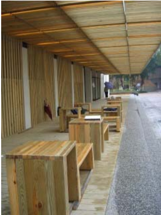
圖3 鹿鳴堂新增木平台

正因為看上這個地區人氣滿點，按陳亮全教授的「舟山路環境改善規劃」之構想，在總務處同仁與校規小組成員合作下，委請金光裕建築師事務所巧手打造，鹿鳴堂的一樓設置大面積的木平台和遮簷，一方面呼應共同教室前的松樹平台之元素，一方面也是連接鹿鳴廣場綠地及鹿鳴堂室內用餐空間的轉折點，是一個凝聚人潮、使人潮停留的設計元素。另外，經結構技師完成耐震評估、在結構安全無虞的前提下，於鹿鳴堂建築物的側牆上開門，使鹿鳴堂室內更容易進出，活化鹿鳴堂內部空間。但鹿鳴堂的外觀則予以保存，僅重新粉刷白牆、去除髒漬、清除露台欄杆上已風化不穩固的部分，還以素淨的面貌。