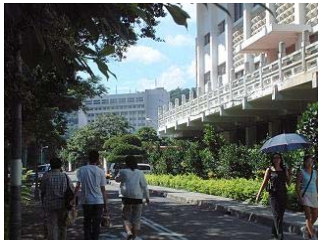
圖 10 鹿鳴廣場和鹿鳴堂中間的空間將做聯結，讓展演活動空間更多元