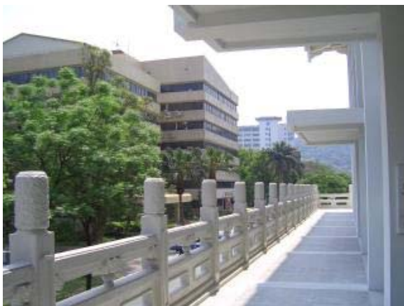
圖5 鹿鳴堂二樓戶外露台經整修後可供利用

鹿鳴堂二樓大禮堂，以表演藝術創意與活動企劃，為鹿鳴堂找到新的定位。鹿鳴劇場將重新定義為一個「黑盒子劇場」，意即劇場本身不限定舞台及觀眾席的相互關係，提供演出者及使用者最大的可能性，是個大約可容納觀眾 200~300 人的劇場空間。配合此一構想，戲劇系師生自 2004 年暑假開始積極投入鹿鳴劇場規劃作業；從場地測量、展演空間規劃、裝置設計製作都一手包辦；讓創意校園空間改造有更多師生的參與。