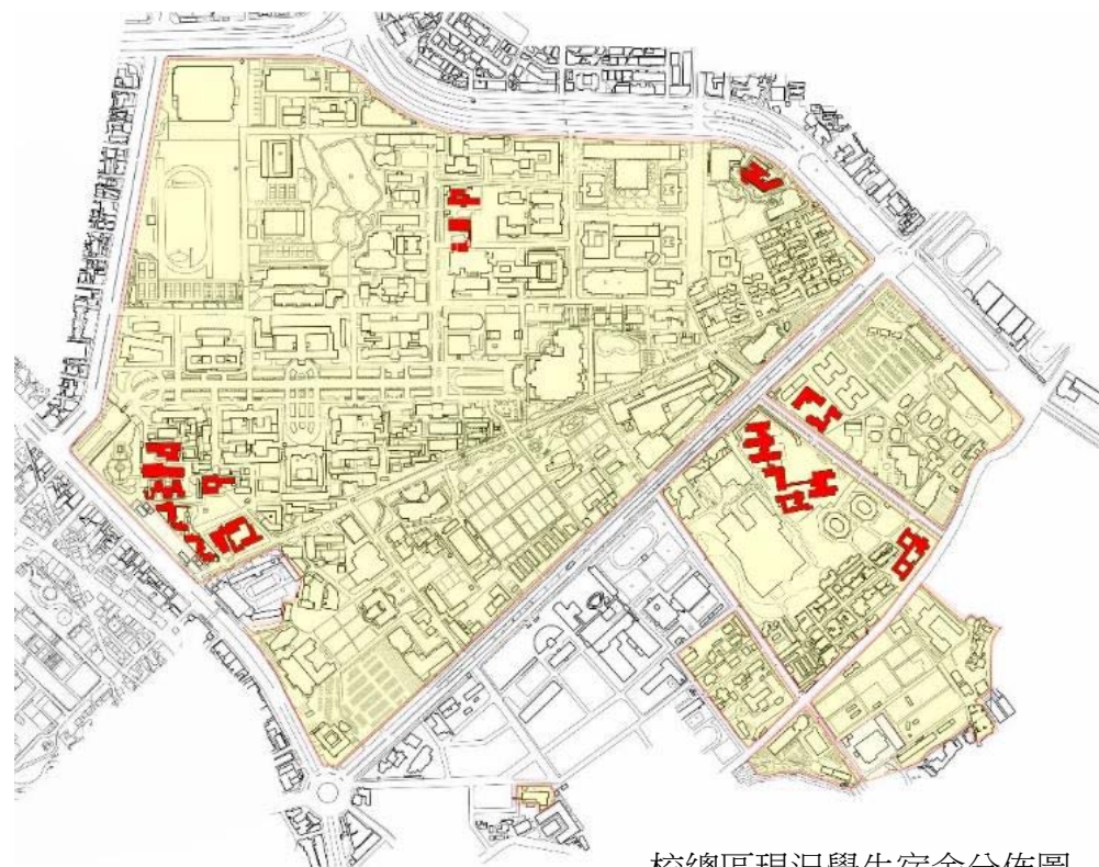
校總區現況學生宿舍分佈圖

第5章校級服務空間問題診斷與建議分為：5.1 校總區教學研究設施、5.2 校總區住宿設施、5.3 校總區服務設施(含：校總區藝文設施、體育設施、休閒與飲食設施、交通設施、停車外圍化、與自行車管理)。本章節內容係整理目前校級服務空間之現況，並提出問題與相關建議。