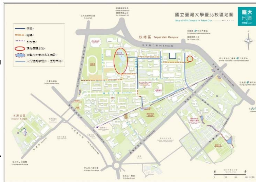
校總區校園藍綠帶示意圖

第6 章校園規劃策略性構想分為：6.1 資產導向式規劃，6.2 文化校園，6.3 藝術校園，6.4 生態與永續校園，6.5 友善校園，6.6 智慧校園。